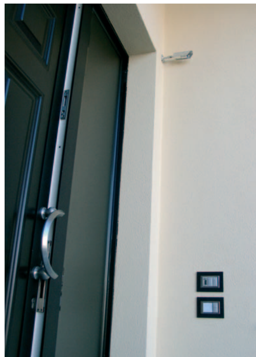
Porta di ingresso: riscontro elettrico, sul bordo si intravede la barriera infrarosso e nella zona interruttori il punto chiave e il lettore di prossimità (sopra il campanello), mentre una mini telecamera è puntata sul vialetto di accesso

1. La soluzione è stata trovata nei sistemi di comando Wolf Safety, omologati IMQ Allarme al massimo livello. Il comando è dato da una chiave elettronica integrata con la funzione trasponder. Si tratta di un oggetto piacevole, con funzione di portachiavi, ma soprattutto robusto e sicuro. Il comando dell'antifurto è ottenuto con l'inserimento della chiave elettronica, che, con il pulsante di cui è dotata, consente la gestione di 4 aree. L'inserimento è stato voluto quale operazione precisa e determinata che, a differenza dello sfioramento di